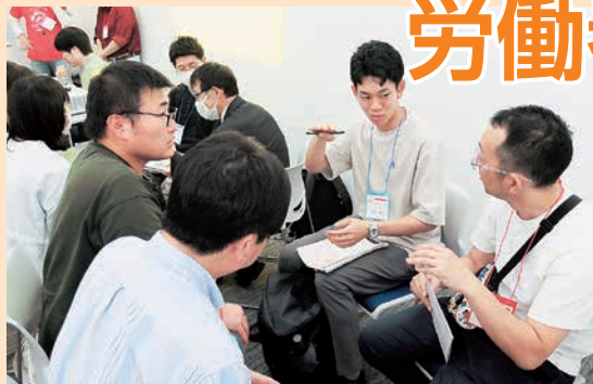
対話と学びあい仲間を増やして組合の求心力を高めよう