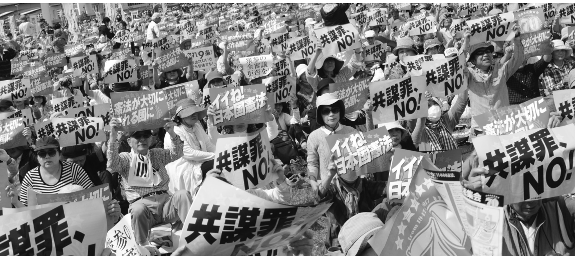
2017年「施行70年、いいネ！日本国憲法5・3集会」5万5000人参加（東京・有明防災公園）

“安倍9条改憲”反対の一点で手をつなぎましょう。3000万人の「戦争はイヤだ」の声を集めて、9条を未来につないでいきましょう。