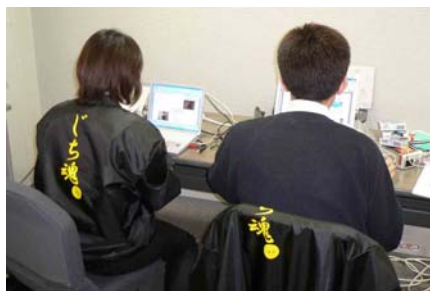
▲見た目地味な編集風景。こんな 感じでやりました。

いやーなんとか速報も最終号ま でたどり着けました。事前号から 始まって約一ヶ月間私たちの生 活は常に速報とともにありまし た。 校正に追われてあんまり寝れな かったのは正直キツかったです が、達成感は一とおです。突然 の取材に答えてくださった皆さ んありがとうございました。そし てこのニュースを読んでもくださ ったすべての人に感謝をささげ ます。