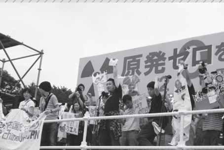
2011.7.2 原発ゼロをめざす7・2緊急行動