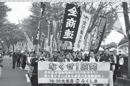
2011.10.30 なくせ原発10・30大集会 IN ぶくしま