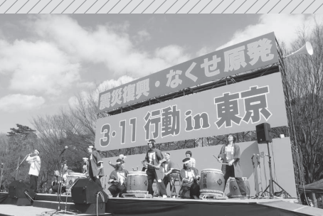
2012.3.11 震災復興・なくせ原発3・11 行動 in 東京

政府は16日、原発再稼働問題の関係閣僚会合を開き、関西電力大飯原発3、4号機の再稼働を決定しました。国会事故調査委員会での福島原発事故の検証も途上で、まともな原子力規制機関も設置されておらず、原子炉メーカー任せのストレステストや暫定的な安全基準を根拠とする無謀きわまりない決定です。