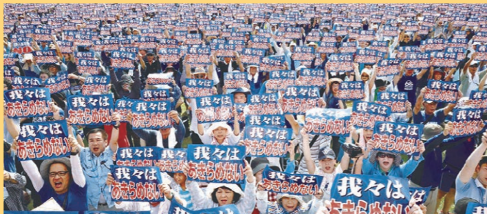
「我々はあきらめない」と記したメッセージボードを掲げる沖縄県民大会参加者 2017年8月12日、那覇市